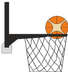
Diagram 3 De bal is in de basket

31-17 Stelling Het is een interference overtreding indien een verdedigende speler de bal raakt terwijl de bal zich in de basket bevindt.